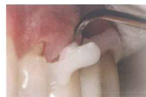
スクレーラー等で素早く除去。