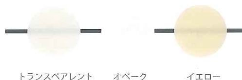
トランスペアレント オパーク イエロー

光透過性によって3種類をラインナップ。光透過性が2～3%の「オパーク」は、チタンアバットメントを使用したインプラント上部構造の接着に適しています。