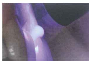
予備照射し、半硬化させます。