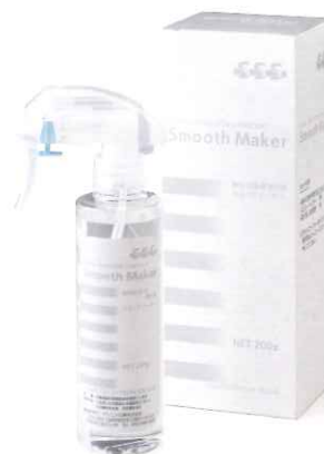
スムーズメーカー 歯科印象用滑沢剤 200gボトル