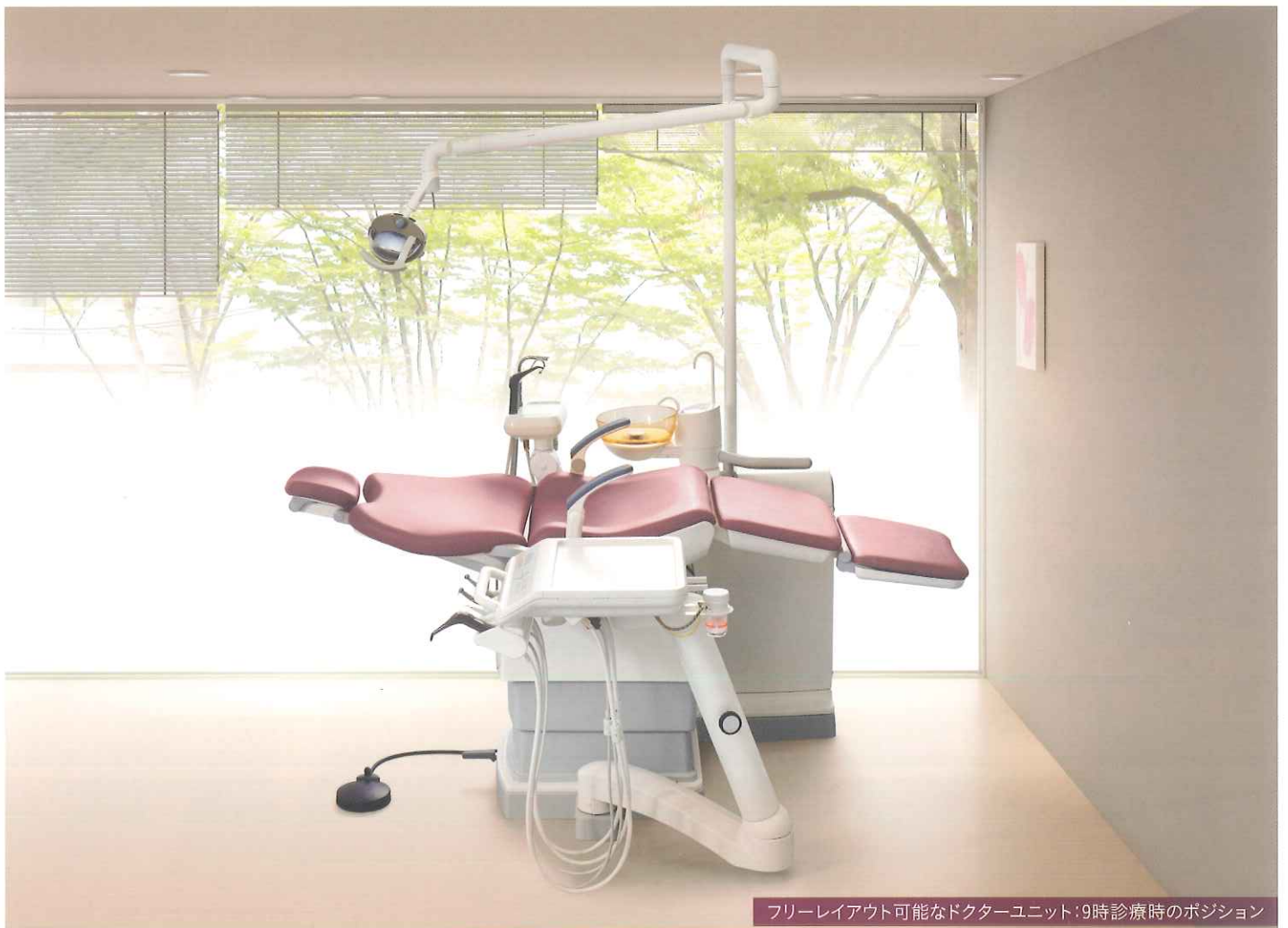
フリーレイアウト可能なドクターユニット：9時診療時のポジション