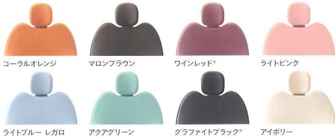
コーラルオレンジ マロンブラウン ワインレッド* ライトピンク