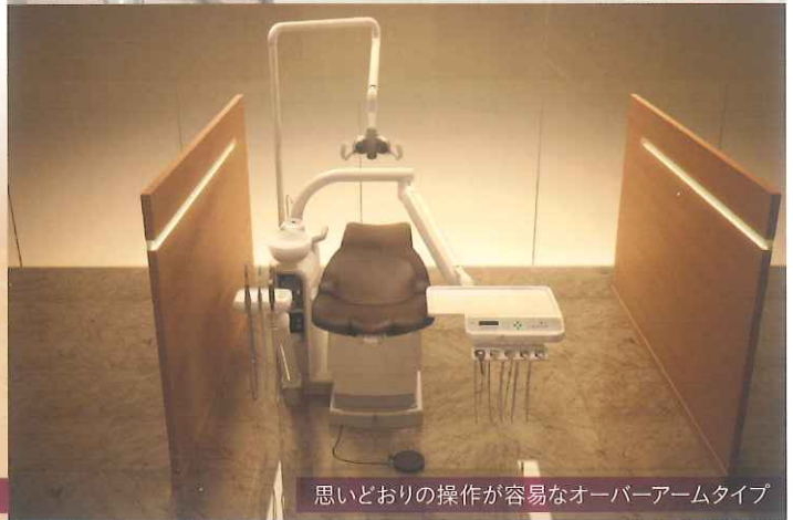
思い通りの操作が容易なオーバーアームタイプ