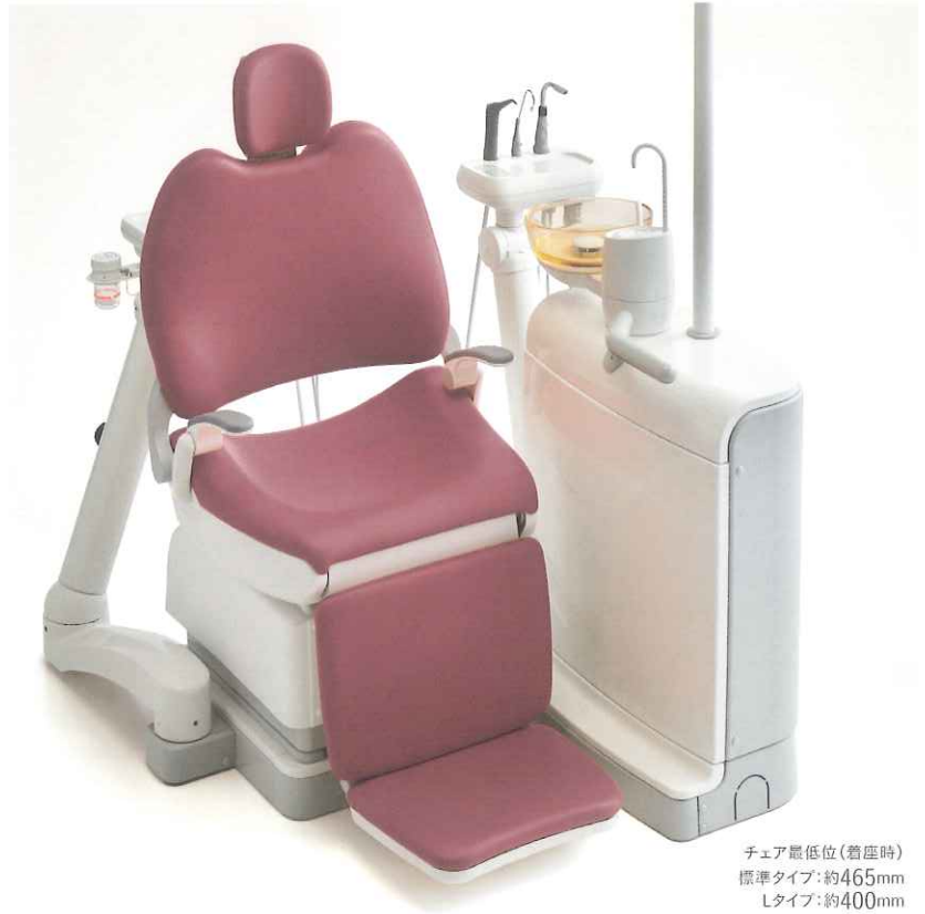
チェア最低位(着座時) 標準タイプ:約465mm Lタイプ:約400mm