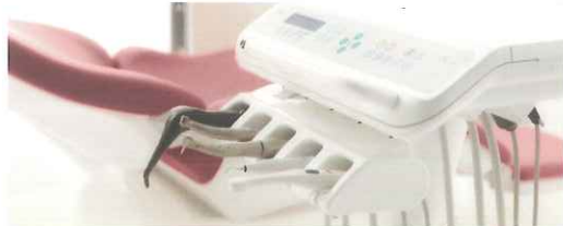
パリオス2 スケーラー

バリエーション豊かなスケーラー*、ピルトインタイプの歯面清掃器*や口腔内カメラ*など、診療により有効なインストゥルメントを搭載できます。*オプション