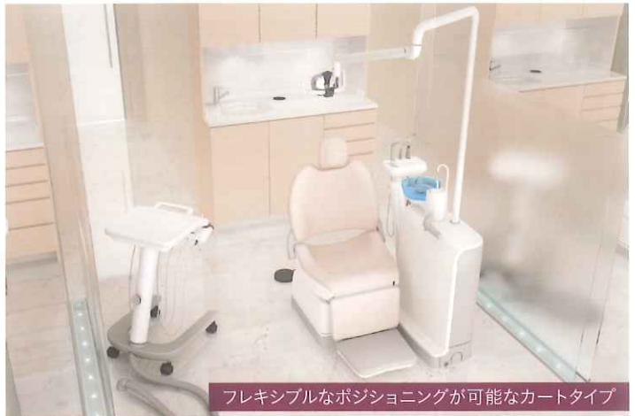
フレキシブルなポジショニングが可能なカートタイプ