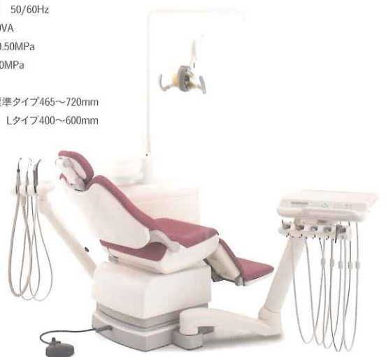
*掲載のチェアシートカラー(特別色:ワインレッド)は、受注生産となります。

※色調は印刷のため、現品と若干異なることがあります。 ※モニタ画面写真は、ハメ込み合成のため実際とは若干異なります。 ※会社名、製品名称等は各社の商標または登録商標です。 ※ガラス製のスピットには、製造上やむを得ず小さな気泡が混入することがありますが、使用上に問題はございません。ご了承ください。