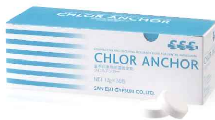
クロルアンカー 歯科印象用除菌固定剤 錠剤 12g×30包/箱