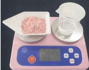
※初期表示はアルギン酸の REGULAR に設定されています。

ご使用方法はとっても簡単!! 計量したい粉末を液晶画面で選択し、 ボタンを押すだけ。あとは粉末を入れ、 デジタル表示された数値を0になるまで水を注ぎます。