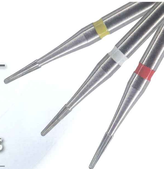
オールセラミッククラウン