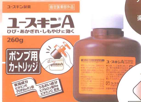
付け替え用カートリッジ 価格 1,315円