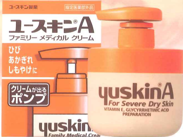
ポンプ 260g 価格 1,505円