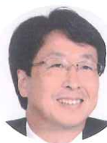
櫻井 薫 東京歯科大学 老年歯科補綴学講座 教授