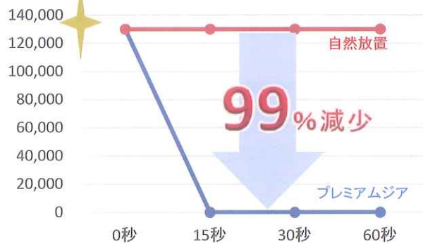
大腸菌(O-157)に対する除菌効果試験