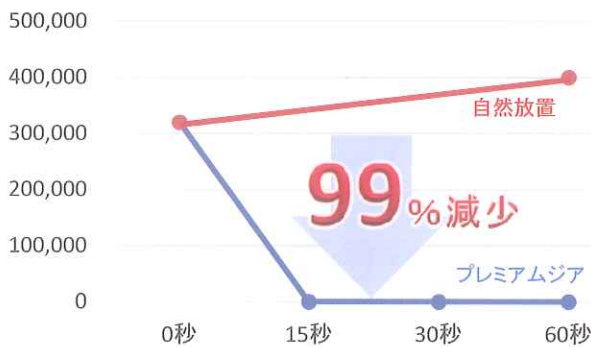
黄色ブドウ球菌に対する除菌効果試験