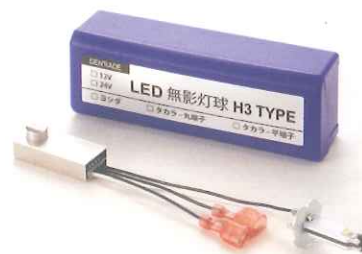
12V&24V H3 TYPE (ヨシダ・タカラ用) エイチサン タイプ