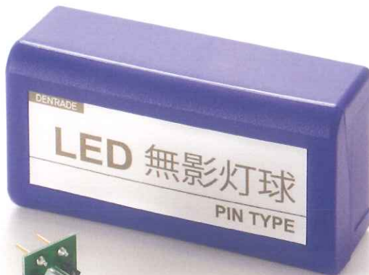
12V PIN TYPE (モリタ用) ピン タイプ

アンケート、又実験の結果色温度は 3,800 - 4,200K に設定しました。 数値が高いほど光が青味の色で 小さければ赤味になります。 太陽光は5000 - 6000Kです。