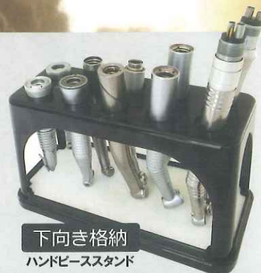
下向き格納 ハンドピーススタンド