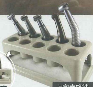
上向き格納 ハンドピーススタンド2