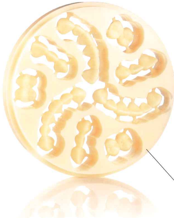
販売名:ワックスディスク