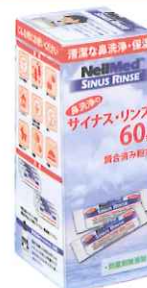
サイナス・リンス リフィル 60包 (調合済みサッシュエ 60包)