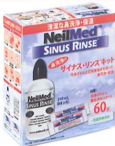
サイナス・リンス キット 60包 (ボトル+調合済みサッシュエ 60包)