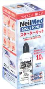
サイナス・リンス キット 10包 (ボトル+調合済みサッシュエ 10包)