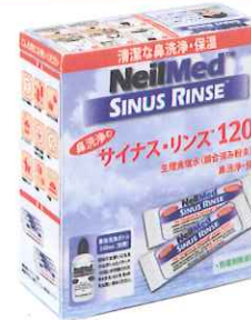
サイナス・リンス リフィル 120包 (調合済みサッシュエ 120包)