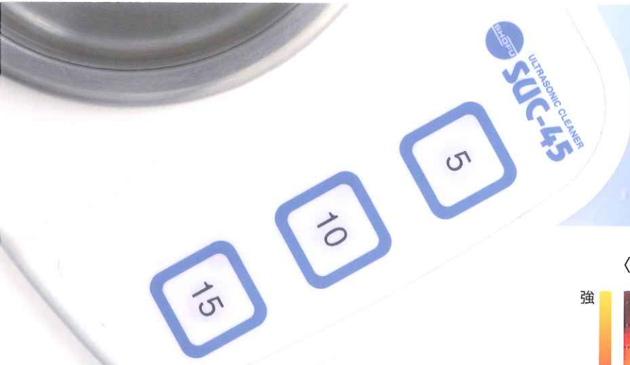
〈超音波の強度分布〉