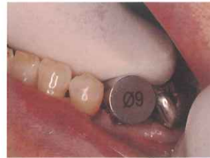
Φ9 ノンドリリングガイドでサイズ確認