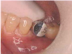
Φ7.5 ノンドリリングガイドでサイズ確認