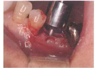
Φ9 ドリルガイドでイニシャルドリル