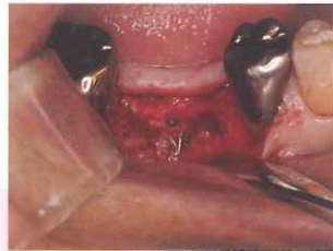
イニシャルドリル後の状態