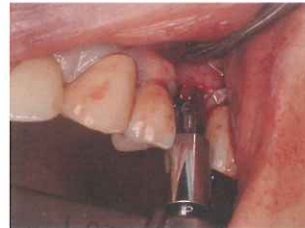
Φ6 ドリルガイドでイニシャルドリル