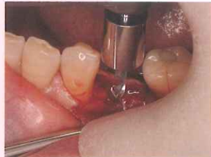
Φ7.5 ドリルガイドでイニシャルドリル