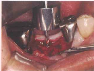
Φ12 ドリルガイドでイニシャルドリル