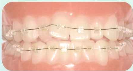
レベリングに使用