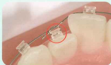
リガチャーワイヤーで牽引