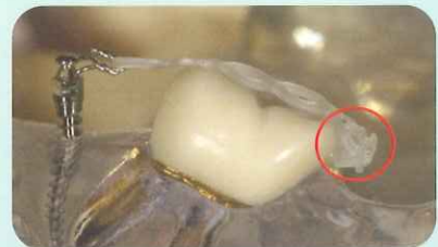
リンガルボタンとして使用