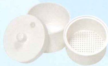
◀ ソーキングカップ ANI0404050 高さ8×φ上9×φ下8.6(cm) (取っ手含む) 参考医院価格：¥2,940/個