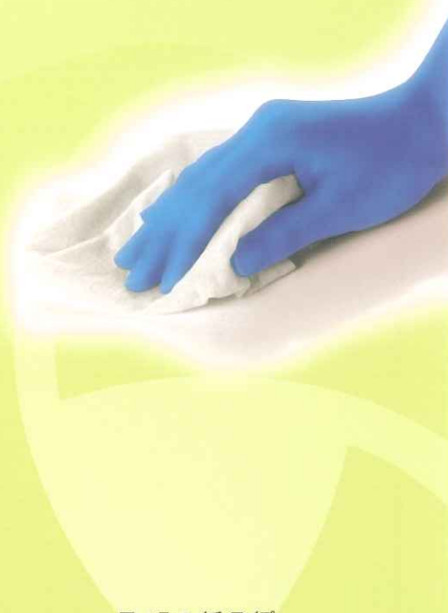
▼ エス エイチ ワイプ