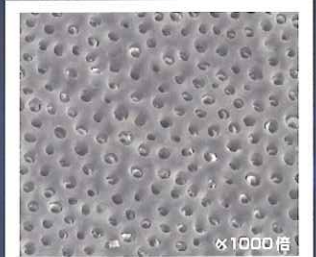
EDTA使用後：象牙細管の開口が見られ、根管壁スマヤー層は除去されています。