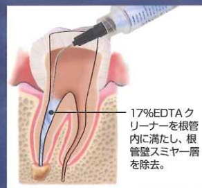
17%EDTAクリーナーを根管内に満たし、根管壁スマヤー層を除去。