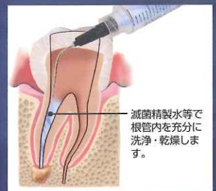
滅菌精製水等で根管内を十分に洗浄・乾燥します。