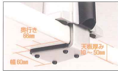
クランプのサイズ