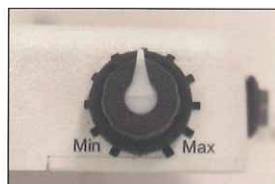
ダイヤル式の調光機能