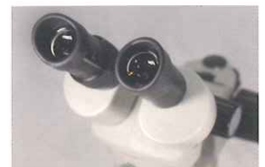
マルチコーティングレンズを搭載