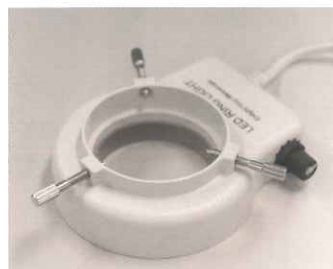
アルゴスコープ用 LEDリングライト (オプション)