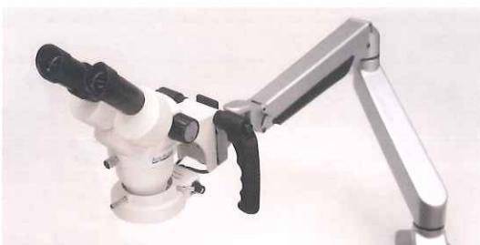
アルゴスコープ アームタイプ2