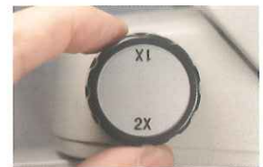
クイックにレンズの切り替えが可能