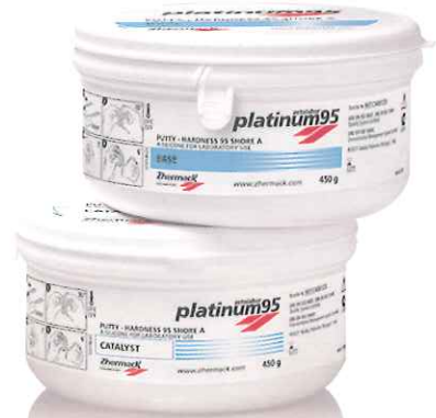
ベース450g+キャタリスト450g