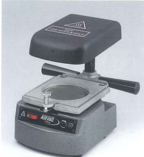
エア-動源接続が必要です。