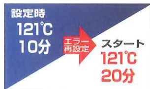
●設定不備はエラー音で告知