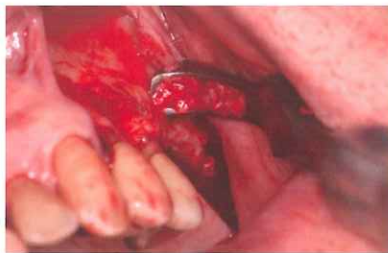
採取した骨を確実に保存