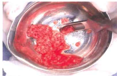
多くの骨を短時間で採取