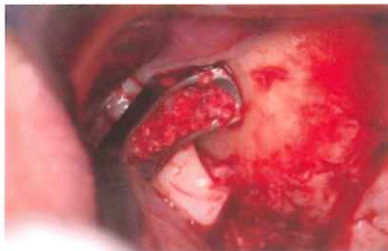
どんな角度からも骨を採取