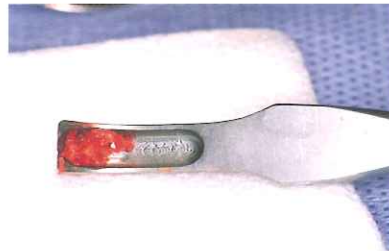
理想的な形状によりトレー上で安定