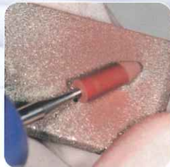
ポイントのドレッシング