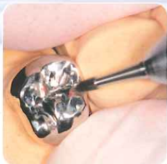
ハードメタルバー 咬合面の調整