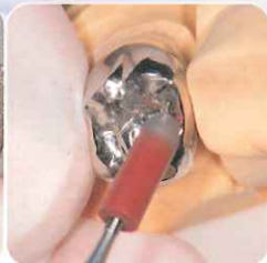
ピンポリッシャー