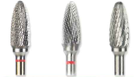
UMタイプ EFタイプ Eタイプ