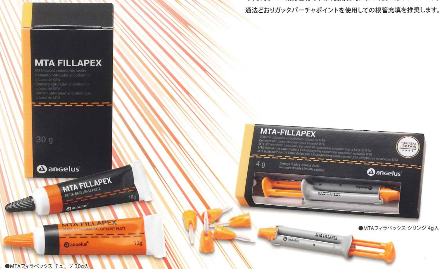
●MTAフィラペックス チューブ 30g入