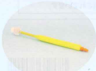
介護用サポートブラシ