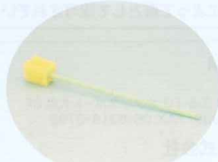
口腔ケア用スポンジブラシ