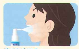
液が広がりやすい