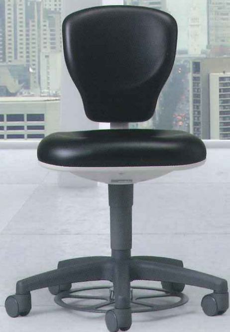
MOA Nr α