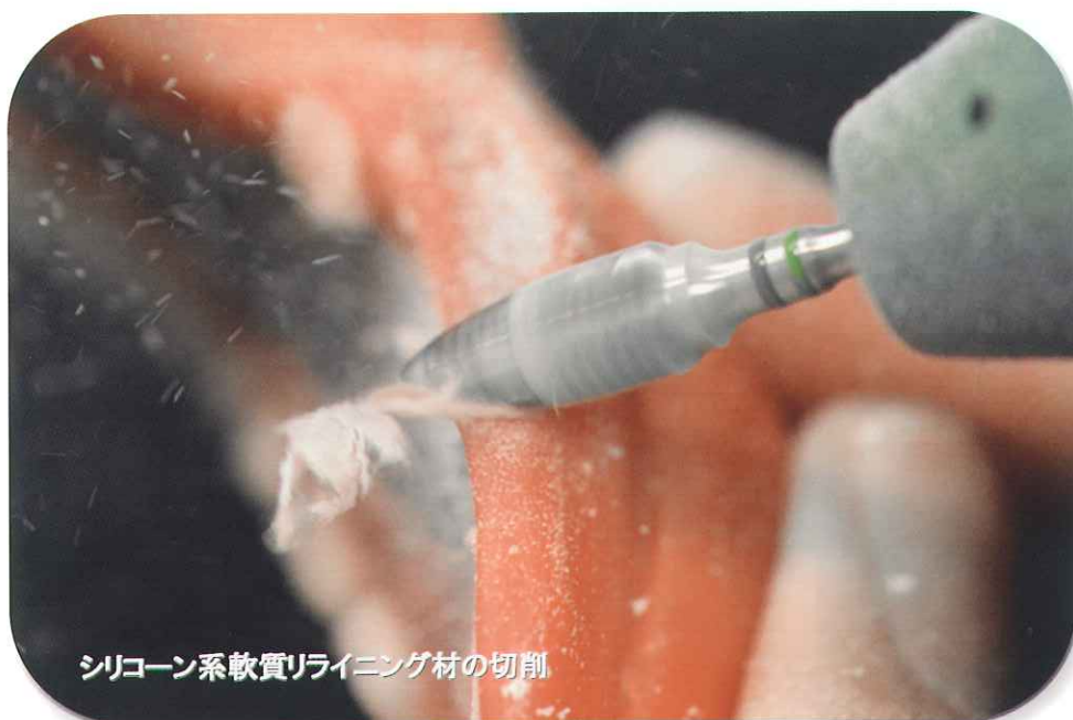
シリコン系軟質ライニング材の切削