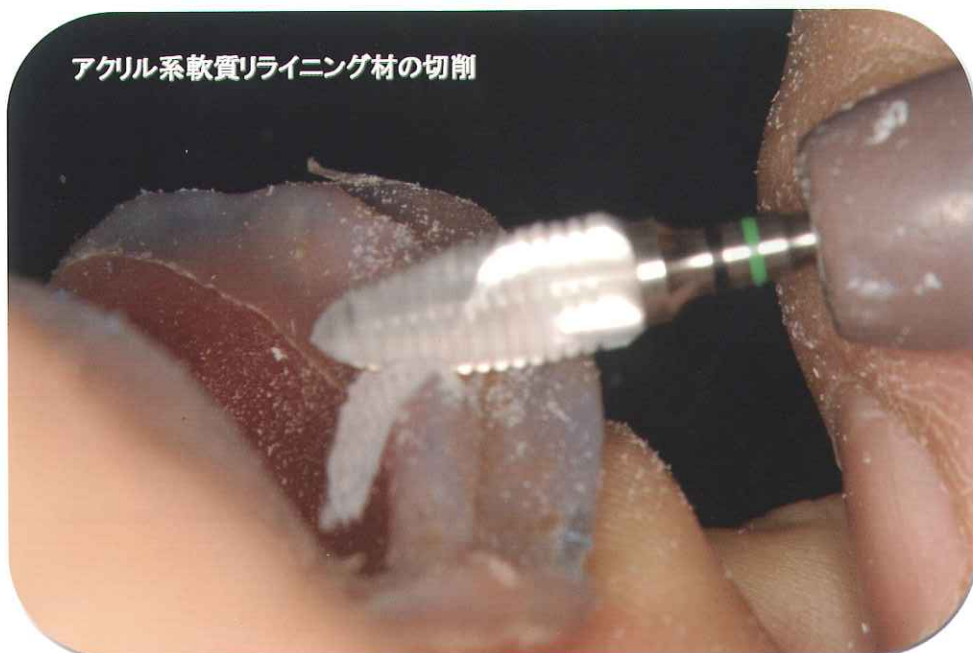
アクリル系軟質ライニング材の切削