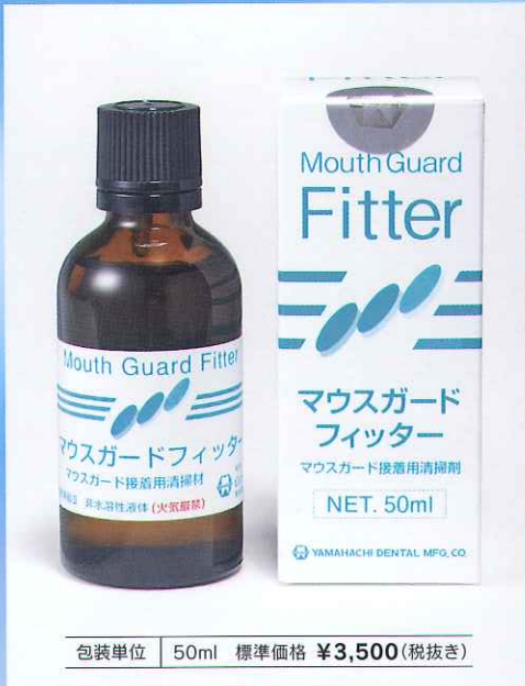
包装単位 50ml 標準価格 ¥3,500(税抜き)

接着力低下の原因となる汚れを清掃しラミネートマウスガードの1層目と2層目の接着を強固にします