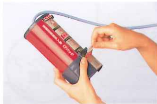
2.弾き手を引き抜く