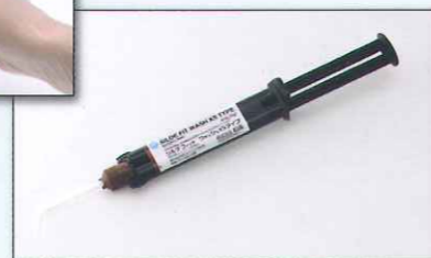
移し替え不要なウォッシュXSタイプ