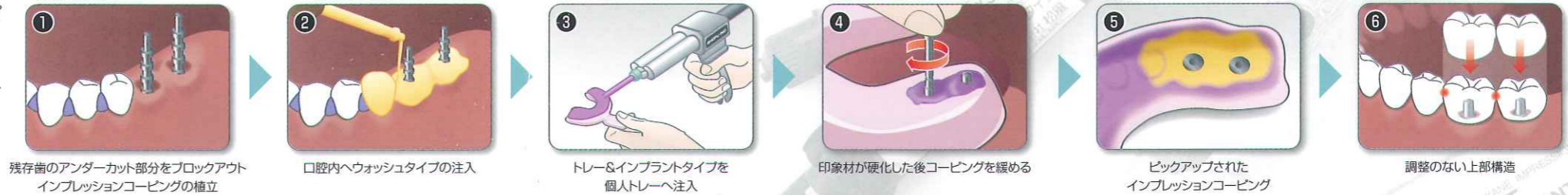
① 残存歯のアンダーカット部分をブロックアウト インプレッションコーピングの植立

インプラントの印象採得においてコーピングピンを緩める際に、インプレッションコーピングの位置がずれてしまうことがあります。トレー&インプラントタイプは十分な硬度を持ち、インプレッションコーピングをしっかりと保持し、口腔内から撤去することができます。