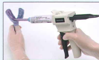
軽い力で押し出せる トレー&インプラントタイプ

トレーを持ちながら片手の軽い力で簡単に押し出せます。専用シリンジへの移し替えが不要なウォッシュXSタイプと合わせてご使用することで、気泡混入が少なくトレー&インプラントタイプとの連合印象も操作時間にゆとりが持てます。