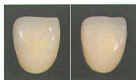
A2 HS A2