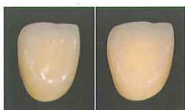
A3 HS A3