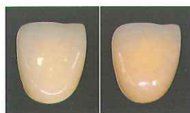
A3.5 HS A3.5