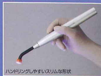
ハンドリングしやすいスリムな形状