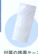
付属の携帯ケース