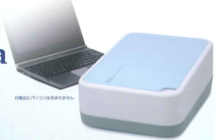
付属品にパソコンは含まれません