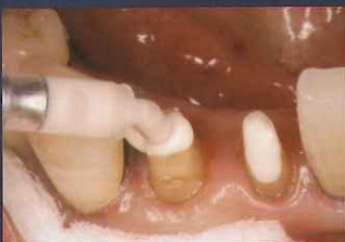
ポストホールへの注入