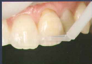
動揺歯固定での 隣接面への塗布