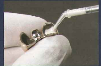
ブリッジ内冠への注入