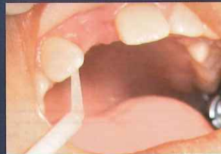
接着ブリッジでの 支台歯への塗布