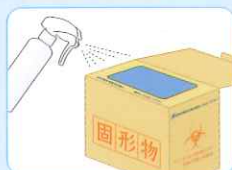
感染性医療廃棄箱へ直接 除菌