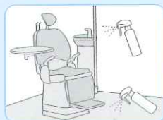
診察室の床や機器類の除菌