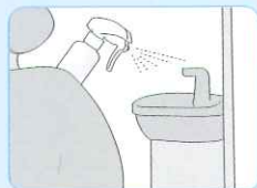
スピットンの除菌