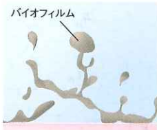
汚れが剥がれ落ちるイメージ

義歯のヌメリの原因はバイオフィームです。キラリ錠剤は二酸化チタンの触媒効果でバイオフィームに浸透して剥がし落とします。汚れの再付着を防ぎカンジダ菌や細菌を除菌・脱臭します。また無香料ですので、刺激臭が苦手な方にもお勧めできます。