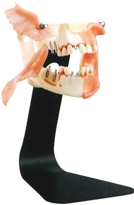
インプラント カウンセリング模型 [PE-IMP007]