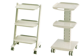
アシスタントカート マルチカート