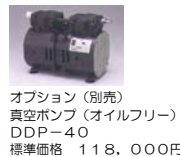
オプション(別売) 真空ポンプ(オイルフリー) DDP-40 標準価格 118,000円