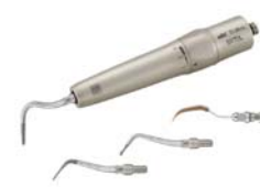
標準価格 形成用 1本入 15,000円 初期う蝕除去用 1本入 13,500円 インプラント・補綴物用 3本入 2,800円 3,000円