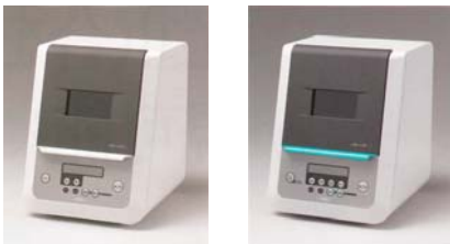
ジーシー ラボキュアL ジーシー ラボキュアHL