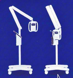
小さくたんでしまえる！ 使い勝手の良いデザイン