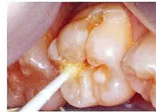
バルクベースライナーIIを塗布、エアブロー後、照射5秒