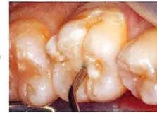
バルクベースハードII ミディアムフロー(マルチ)で裏層から最表層まで一括充填、照射10秒