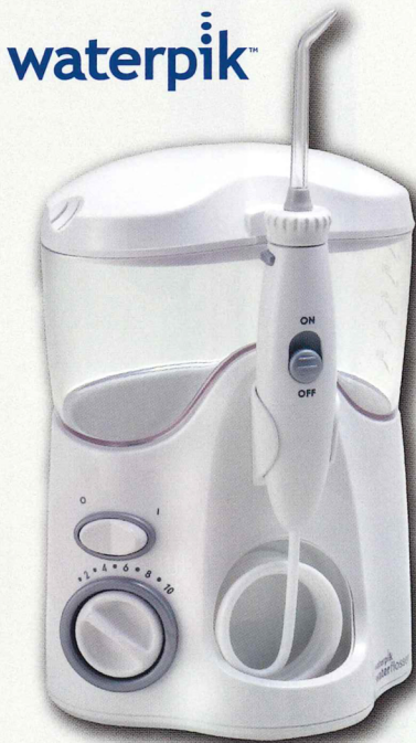
※入浴時はご使用いただけません