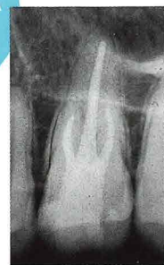
※JIS T6006 (2018) 準拠 (サンメディカル社試験による)